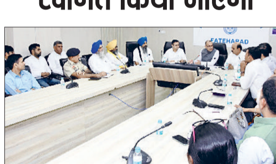
फतेहाबाद। नगर कीर्तन यात्रा को लेकर तैयारियों की समीक्षा बैठक करते उपायुक्त।