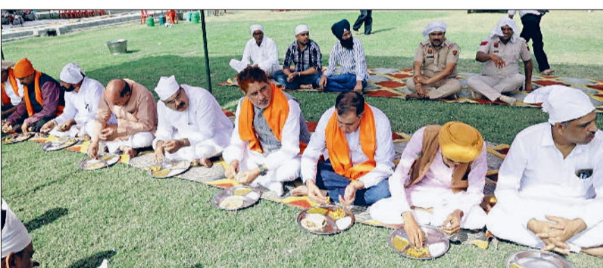
टोहना। प्रकाश उत्सव पर आयोजित कार्यक्रम में लंगर प्रसाद लेते सांसद सुभाष बराला।