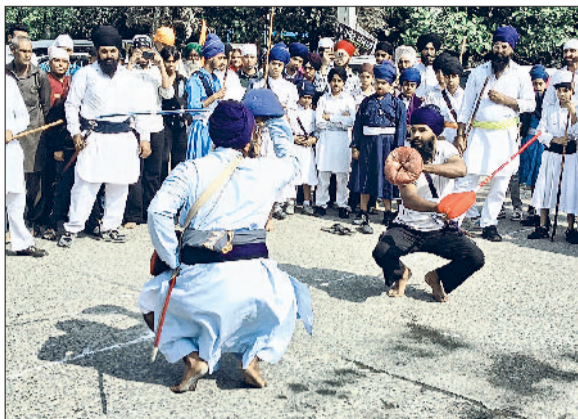
फतेहाबाद। नगर कीर्तन फूलों से सजी पालकी व नगर कीर्तन की अगुवाई करते पांच प्यारे व नगर कीर्तन में गतका प्रस्तुत करते यूथ खालसा सोसायटी के सदस्य।