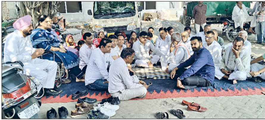
फतेहाबाद। नगरपरिषद में धरने पर बैठे प्रधान व अन्य पार्षद। व नगरपरिषद कार्यालय के गेट पर जड़ा ताला।