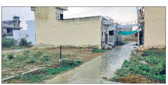
सिरसा। क्षेत्र में बूढ़ाबांदी के मौसम में टंडक।

चोपटा क्षेत्र के विभिन्न गांवों में मंगलवार बाद दोपहर एकाएक मौसम में बदलाव हुआ। इसके बाद बूढ़ाबांदी शुरू हो गई। बरसात से सैमप्रस्त गांवों में नुकसान है। जहां पर गेहूं की बिजारी करने में परेशानी आई। वहीं दूसरी तरफ कई गांवों में बरसात से काफी फायदा मिला है। यहां पर किसानों ने सरसों व चना की बिजारी की है। मौसम में मंगलवार को अचानक बदल गया। मौसम को लेकर कृषि मौसम विज्ञान विभाग चौधरी चरणसिंह हरियाणा कृषि विश्वविद्यालय हिसार ने मौसम पूर्वानुमान जारी किया है। विभाग के अनुसार हरियाणा राज्य में