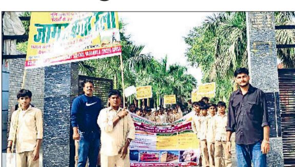
सिरसा। जागरूकता रैली निकालते रकूली बच्चे।

कृषि एवं किसान कल्याण विभाग द्वारा पराली जलाने की घटनाओं पर पूर्ण अंकुश के लिए जिला में तेजी से जागरूकता गतिविधियों का आयोजन किया जा रहा है। जागरूकता टीमों ने मंगलवार को जिला में नानुआना, धोतड़, खारियां, मल्लेकां, कुत्ताबद, बचेर, बाहिया, असीर में ग्रामीणों के साथ बैठक करके जागरूक किया। टीमों ने