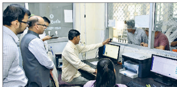
फतेहाबाद। ई दिशा केंद्र में पेपरलेस रजिस्ट्री प्रक्रिया की जानकारी लेते उपायुक्त।